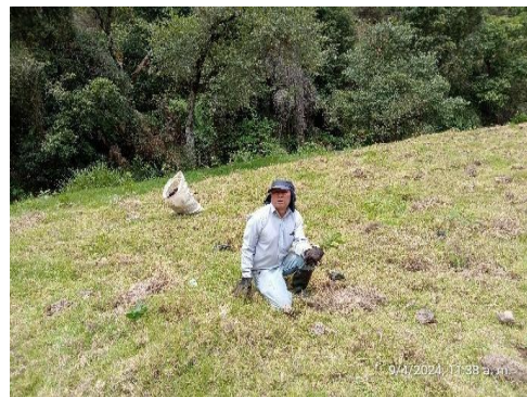
Imagen 1 Siembra Acción Verde