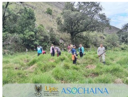
Imagen 4 Siembra Almagua SAS