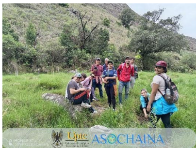
Imagen 3 Siembra Almagua SAS