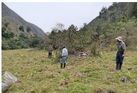
Imagen 1 Siembra Acción Verde